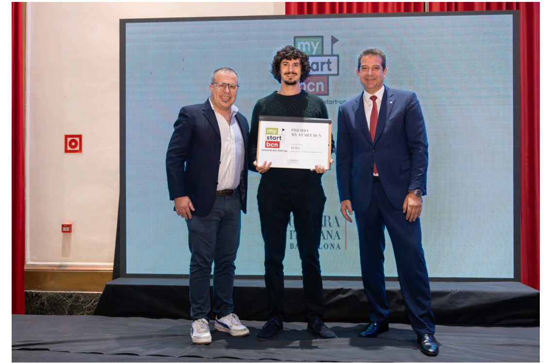
vincitore VIIIª Edizione